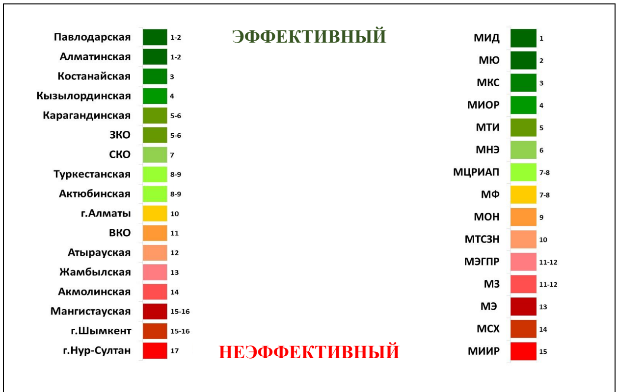
Диаграмма 2. Пилотный рейтинг совокупной оценки министерств и акиматов

Разработанная методика станет одним из инструментов оценки качества реализации Концепции антикоррупционной политики на 2022-2026 годы и, по опыту Южной Кореи, будет постоянно совершенствоваться.